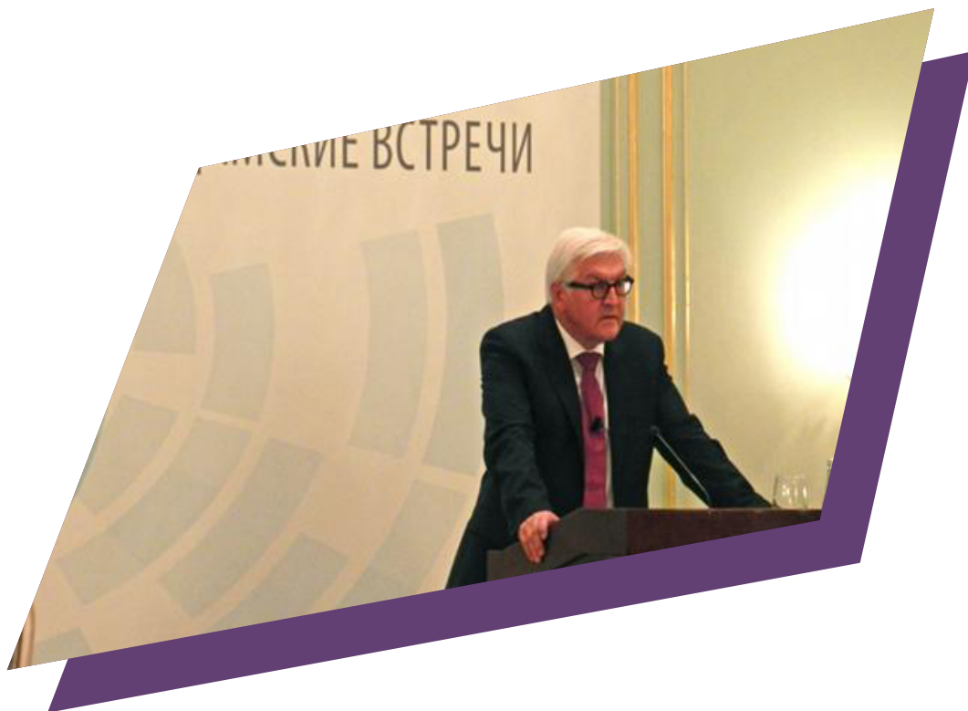
Президент Федеративної Республіки Німеччина Франк-Вальтер Штайнмаєр під час Потсдамських зустрічей у 2016 році в Берліні.

Потсдамські зустрічі як регулярна конференція німецьких та російських високопосадовців – представників Бундестагу ФРН та Федеральних Зборів РФ – для обговорення актуальних тем у сфері культури та науки були ініційовані у 1999 1 році німецьким президентом Романом Герцогом і проводилися спільно з Німецько-Російським Форумом 2 . З того часу зустрічі відбувалися принаймні раз на рік, упродовж останніх кількох років навіть два рази на рік, і це попри зростання агресивності зовнішньої політики Росії впродовж останнього десятиліття. Від самого початку партнером заходу є Фонд Конрада Аденауера, пов'язаний із партією німецьких християнських демократів (CDU) 3 .