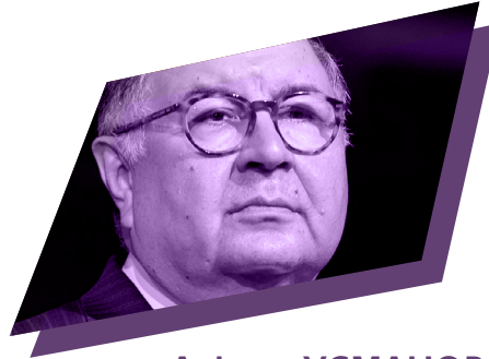
Алішер УСМАНОВ засновник холдингу у сфері металургії та гірського видобування «USM Holdings»