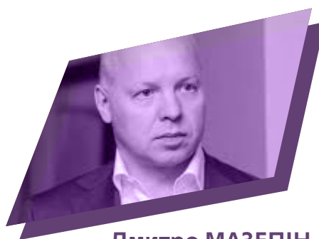
Дмитро МАЗЕПІН голова Ради директорів однієї з найбільших компаній на ринку мінеральних добрив Росії ОХК «Уралхім»