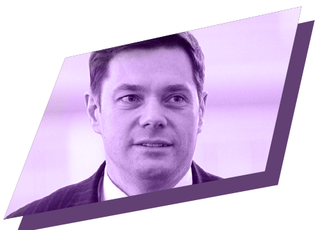
Олексій МОРДАШОВ голова Ради директорів сталеливарної і гірничодобувної компанії ПАО «Северсталь»