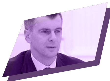
Михайло ПРОХОРОВ президент інвестиційної групи «ОНЭКСИМ»