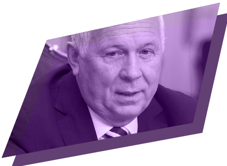
Сергій ЧЕМЕЗОВ генеральний директор державної компанії у сфері високотехнологіч- ної промисловості «Ростех»