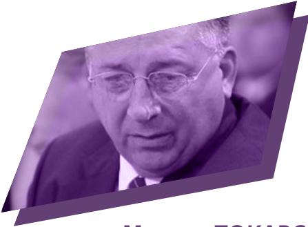
Микола ТОКАРЄВ президент ПАО «Транснефть», яка займається транспортуван- ням нафтопродуктів